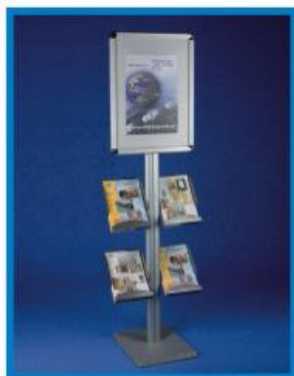
2 S/AL 02