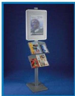
3 S/AL 03