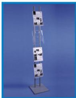
2 FPD 1M