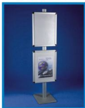
6 S/AL 06