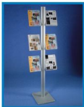
5 S/AL 05