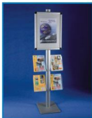
1 S/AL 01

* dostępne również w wersji dwustronnej z podwójną ilością kieszeni