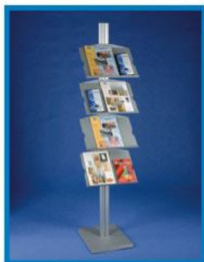
4 S/AL 04