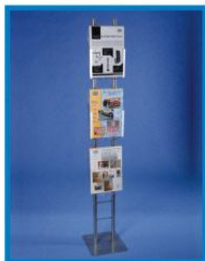
1 FPD MN/A4